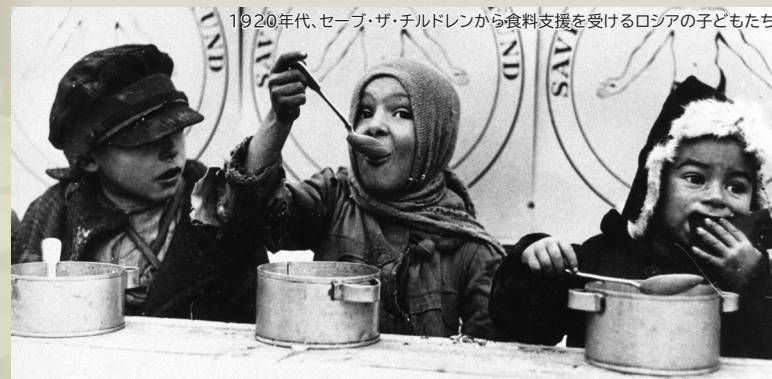
1920年代、セーブ・ザ・チルドレンから食料支援を受けるロシアの子どもたち

生きる、育つ、守られる、参加する。 世界中すべての子どもの権利が実現された 世界を目指して。