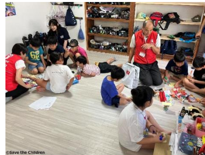
子どもたちへの防災ワークショップの様子

さらに、「子どものための PFA」の普及啓発では、アニメーション動画とリーフレットを制作しました。これらのツールは、能登半島地震および奥能登豪雨に対する緊急支援や「子どものための PFA」研修などのセーブ・ザ・チルドレンの活動現場をはじめ、損保ジャパンで開催する SOMPO 流「逃げ地図」*3 づくりワークショップなど、全国各地で活用されています。