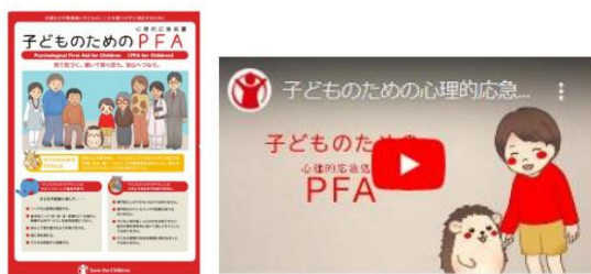
子どものための PFA リーフレット・動画